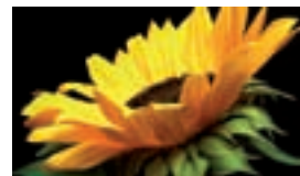
Polymerisationstoner Simitri® HD

Der Simitri® HD Toner bietet eine höhere UV-Lichtbeständigkeit als herkömmlicher Offsetdruck.