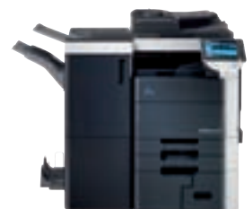
bizhub mit Broschüren-Finisher