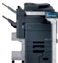
bizhub mit integriertem Finisher