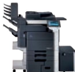
bizhub mit integr. Finisher, Postfach-Finisher u. Großraumkassette