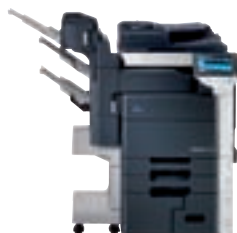
bizhub mit integr. Finisher u. Heft- und Falzeinheit