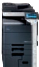
bizhub mit Zusatzkassetten u. Zweifachablage